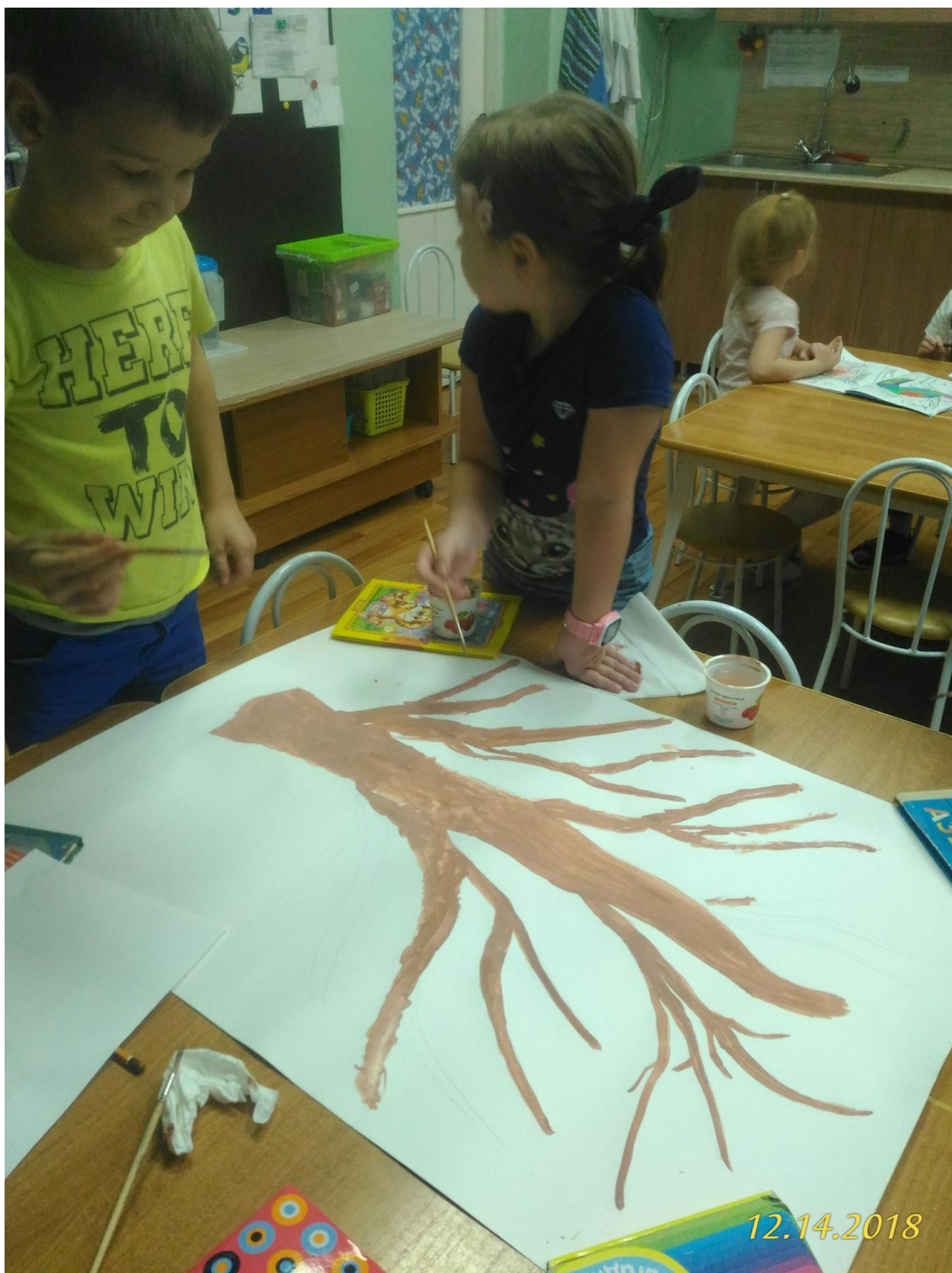
3 этап. Рассадили на дерево птичек. Клеили на двухсторонний скотч.