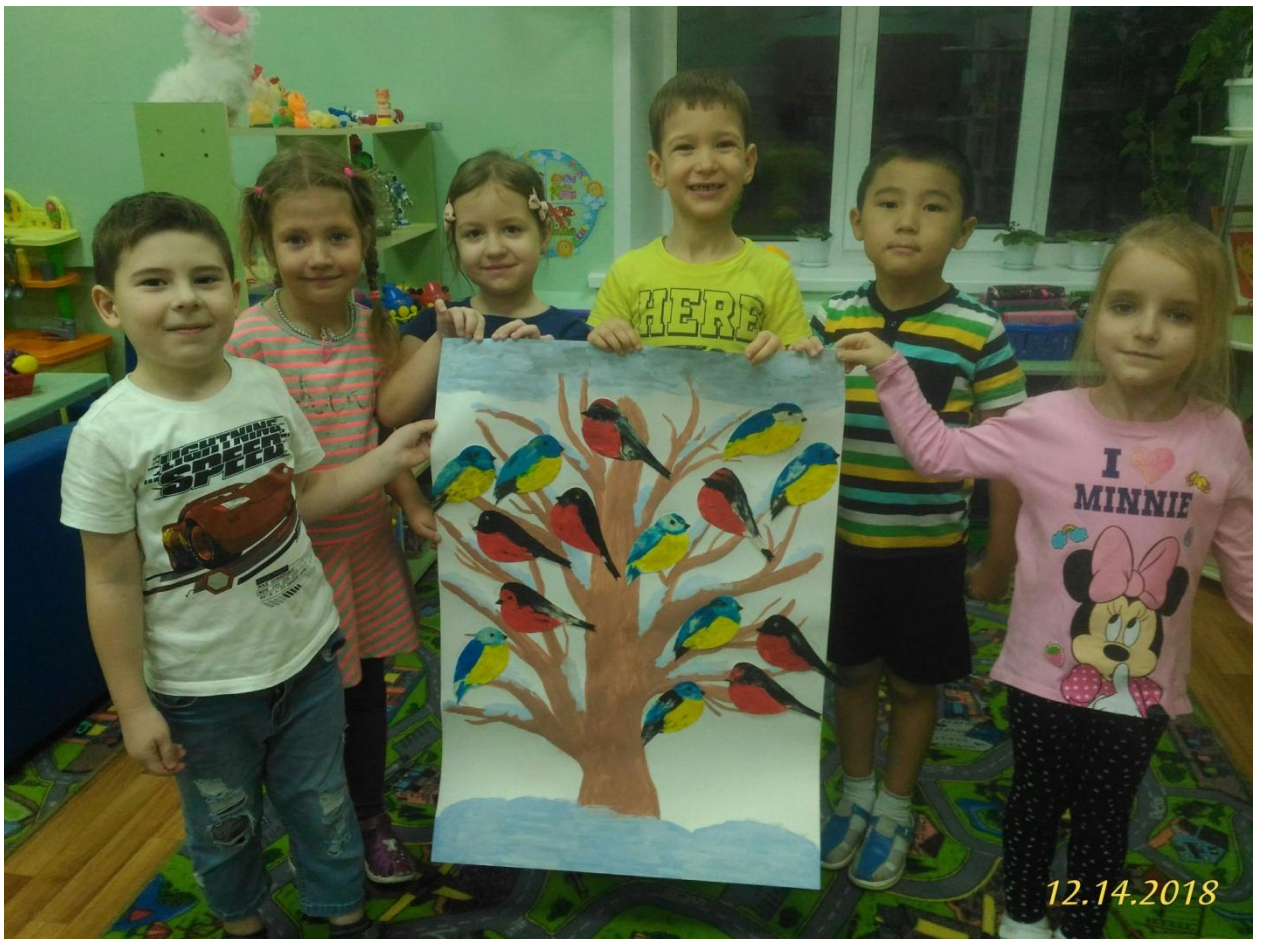
Работа получилась яркая, стайки снегирей и синичек уютно устроились на ветках зимнего дерева.