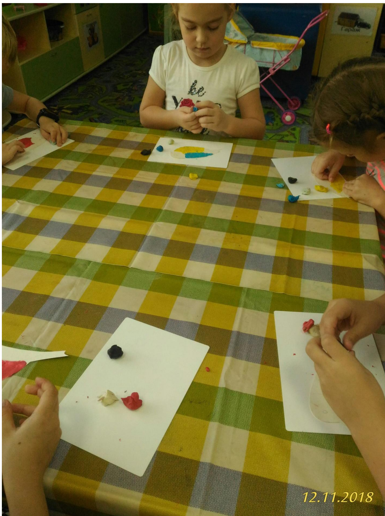
Вот такие разные, чудесные птички у нас получились.